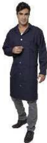
FOTO 4 (BORDADOS – TODOS OS ITENS INCLUSOS, COM EXCESÃO DA FRASE “TRABALHANDO PRA QUEM PRECISA):